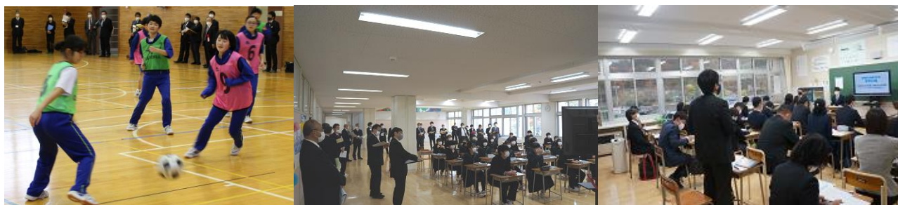
2Bは男女一緒にサッカー 参観者であふれる3A社会 多くの先生方による研究協議

11月5日(金)、県内各地より123名のお客様をお迎えし、本校を会場に学校公開研究会が行われました。これまで「コミュニケーション能力の育成」をテーマに、各学年の発達段階に応じた「聞く」「話す」について、学期ごとの具体的目標を設定し、生徒たちと共に取り組んでまいりました。授業では、教師の説明を聞くだけの受け身の学習ではなく、グループや学級全体での対話を多く取り入れ、他者との協働的な課題追求により、これからの社会をつくっていくための「確かな力」「生きる力」の育成を目指しました。