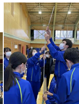
どうすれば高くできるかな