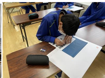
選挙ポスターの作成