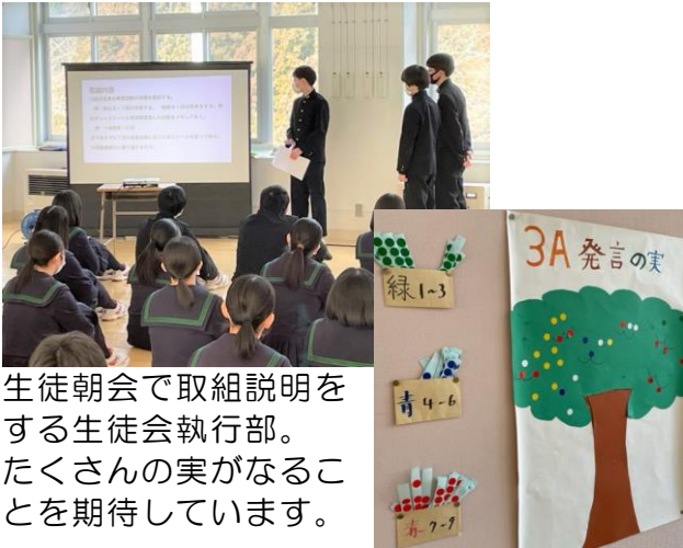
生徒朝会で取組説明をする生徒会執行部。たくさんの実がなることを期待しています。

生徒のアイデアが、このような形となって動き出すということはとても嬉しいことです。この時に大事なことはフォロワーの動きです。リーダーの思いを受け止め、この取組を盛り上げることができれば成功です。よりよい学校づくりに向けて頑張ってくださいと思います。